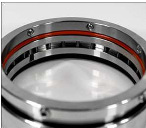
Internal Groove (Mechanical Seal)