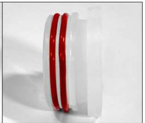
External Grooves (Filter Cartridge)