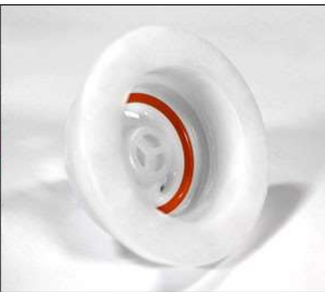
Internal Groove (Drum/Barrel Cap)